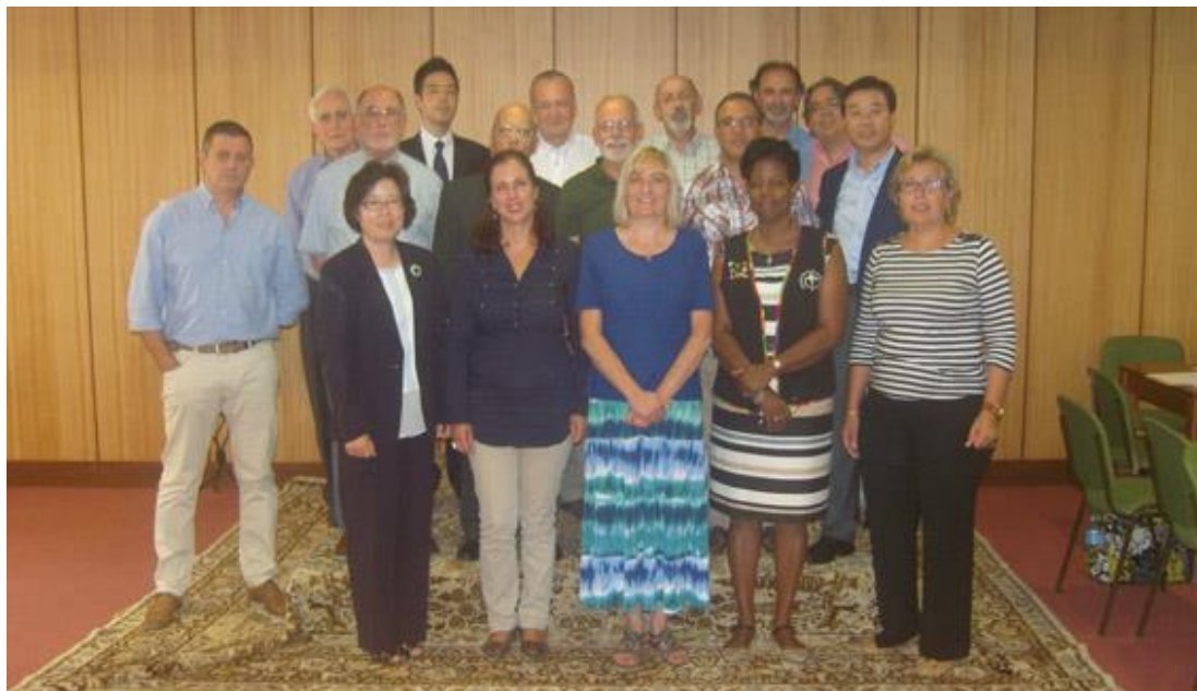
Participantes en el encuentro internacional del OMCC

El boletín del OMCC (desde enero de 2015) será mensual y contará con la participación de cada uno de los Grupos Internacionales de conformidad con el calendario establecido que envió en anexo;