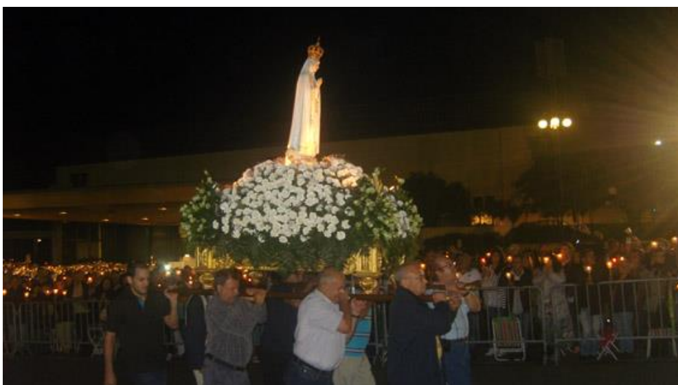
Fátima – Procesión de velas

Septiembre fue un mes muy importante para la Organización Mundial y para todo el Movimiento, pues que en Fátima, los días 12 y 13, estuve una reunión con los Grupos Internacionales donde fueron transmitidas informaciones de gran repercusión y se han tomado decisiones que iran orientando al MCC en los próximos años.