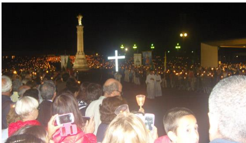
Fátima – Procesión de velas

El día continuò con la participación en la Eucaristía celebrada en la Capilla de las Apariciones, y por la tarde con las ceremonias de la procesión Eucarística, el rezo del Rosario y la procesión con velas.