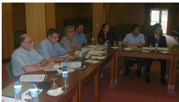
GECC y APG