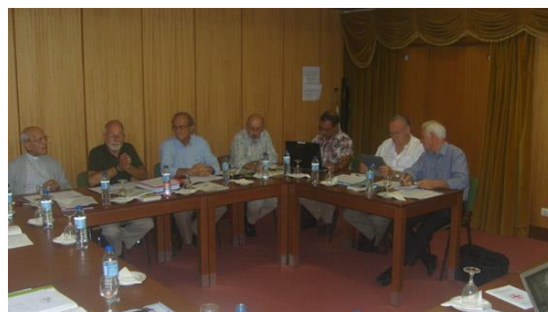
Comité Ejecutivo y GLCC