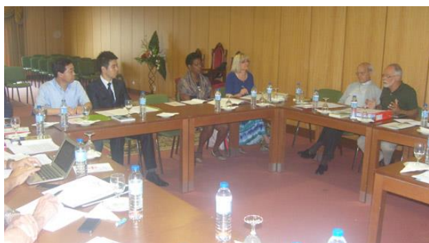
APG y NACG

Dando inicio a la sesión de trabajo fueron presentados diferentes asuntos y adoptadas las resoluciones ya mencionadas, siempre teniendo en perspectiva la armonía, la unidad y singularidad del Movimiento en todo el mundo.